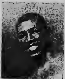
SUGAR BOY NANDO

Un grupo di padvinders a entrega esposa di e senador un ramo di flor. "Adelanta, Alianza para el progreso", un borchu cu un peruano tabata carga, tabata bisa.